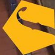
ORQUESTA FILARMÓNICA JUVENIL DEL CAFÉ